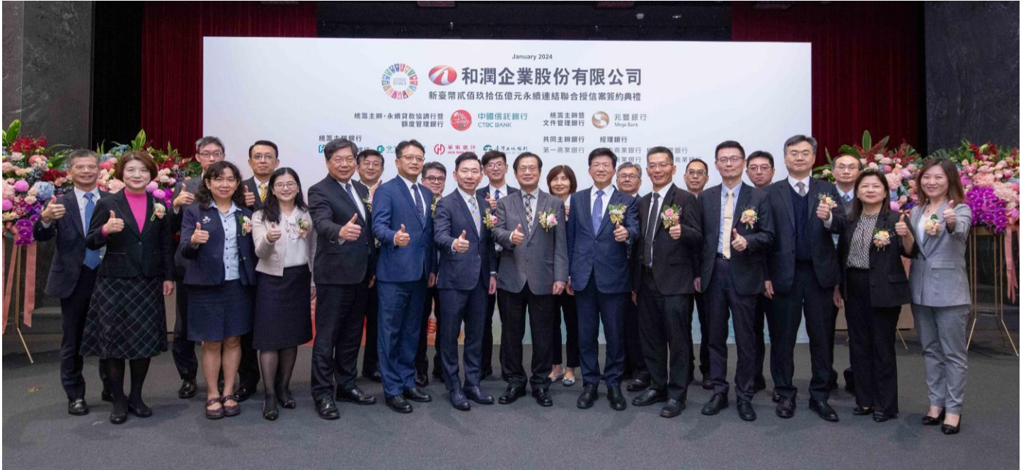
【圖說三】和潤企業永續績效連結聯合授信案獲得 11 家銀行踴躍支持，超額認購 1.48 倍，最終以新臺幣 295 億元完成簽約，參貸銀行團與和潤企業代表合影留念。